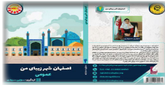
اصفهان شهر زیبای من گر داورنده: سوژین سبزواری