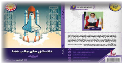
دانستنی‌های جالب فضا گردآورنده: بهینا رستگار