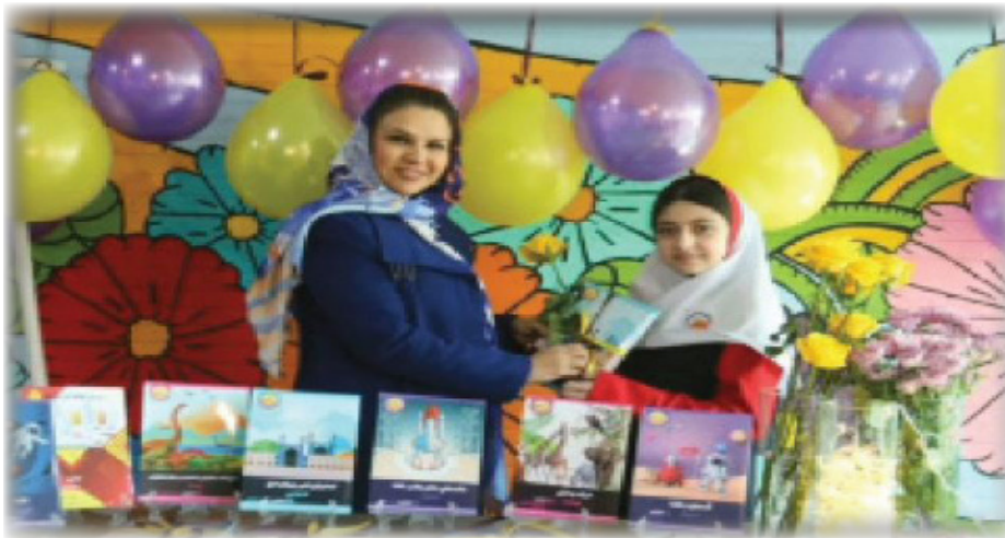
جشن تحویل کتاب به مولفان کتاب ها