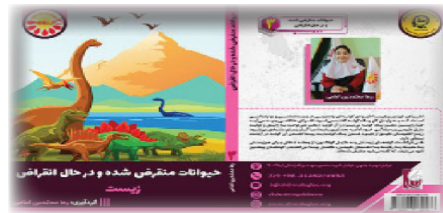
حیوانات منقرض شده و در حال انقراض گردآورنده:رها معتمدین امامی