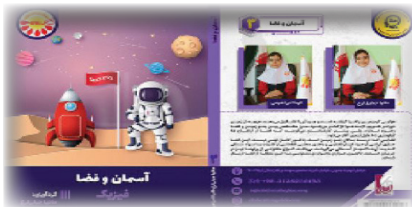
آسمان و فضا گردآورنده: مانیبا جبار زاده-الینا شفیعی