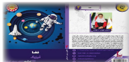
فضا گردآورنده: شایلی سهیلی اصفهانی